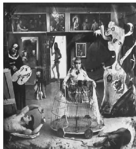
As meninas , de Joel-Peter Witkin