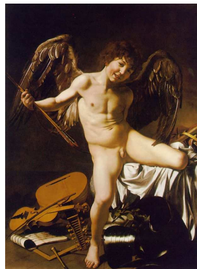
O amor, Caravaggio

"Diz-se que a ironia irrita porque ela nega nossas certezas ao desmascarar o mundo como uma ambigüidade." (Linda Hutcheon)