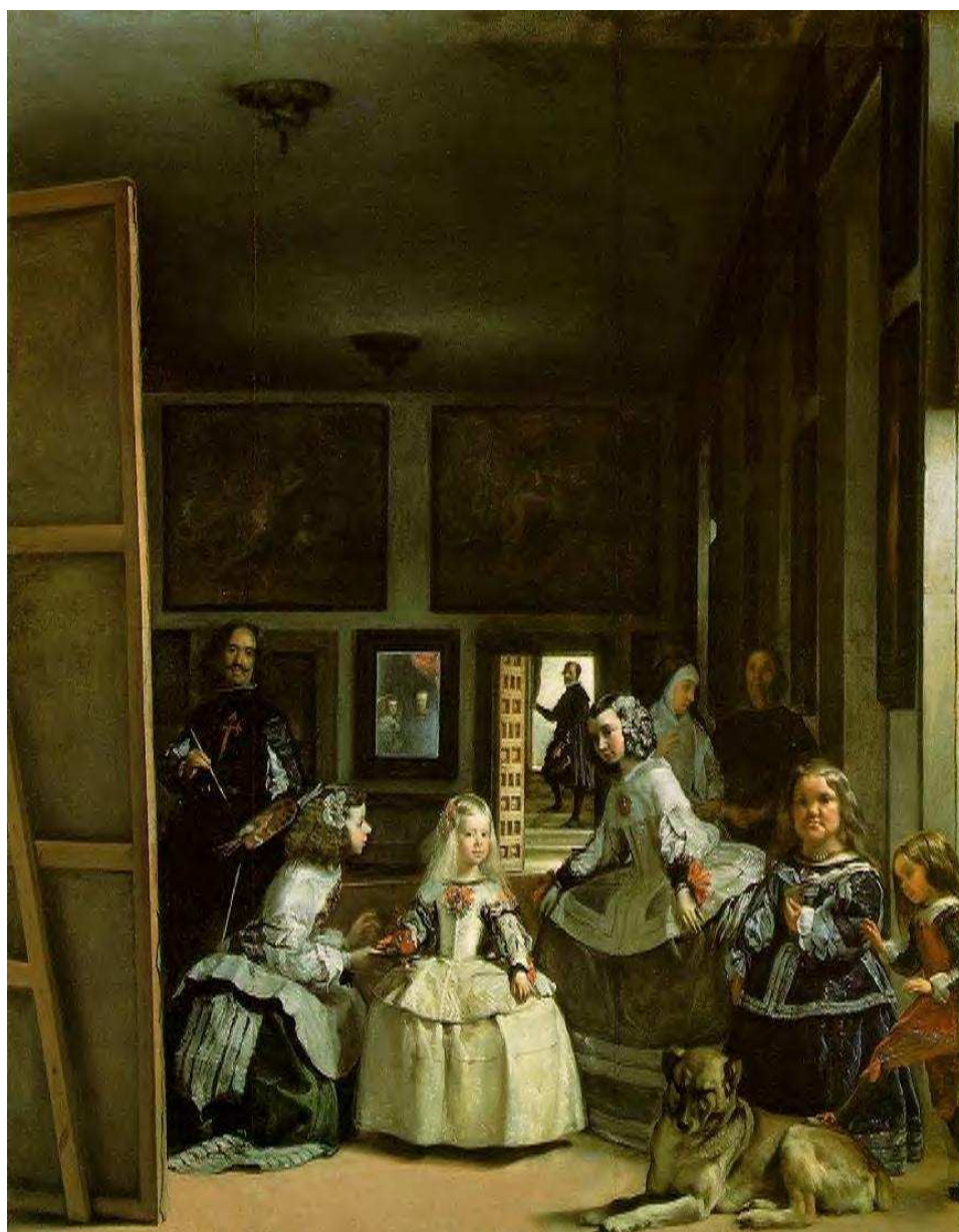
As meninas, Velasquez

"A alma humana é uma caixa donde sempre pode saltar um palhaço a fazer caretas e a deitar-nos a língua de fora, mas há ocasiões em que esse mesmo palhaço se limita a olhar-nos por cima da borda da caixa, e se vê que, por acidente, estamos procedendo segundo o que é justo e honesto, acena aprovadoramente com a cabeça e desaparece a pensar que ainda não somos um caso perdido." (SARAMAGO, 2002, p. 293)